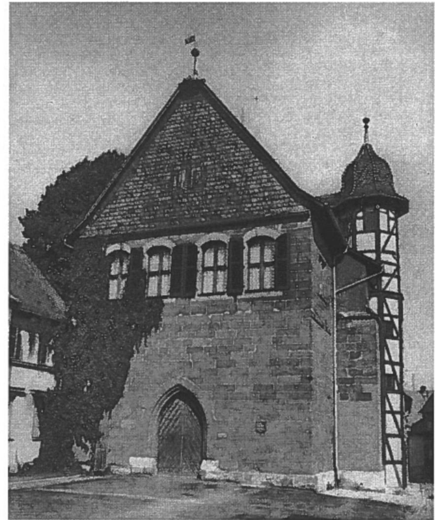
Abbildung 1: Der 1615/16 als Bibliotheksgebäude umgestaltete Chor des Windsheimer Klosters der Augustiner-Eremiten (1291-1525).